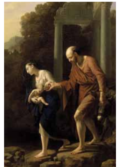
De vlucht naar Egypte, schilderij uit 1710 van Adriaen van der Werff

Volhouden... Net als met dat feesten is zachtmoedigheid en een goed contact onderhouden met allerlei groepen een manier om het vol te houden. Volhouden om een leefbaar leven te hebben in een situatie van voortdurend geweld en voortdurende dreiging, al ruim 40 jaar lang, of eigenlijk al sinds men een eeuw geleden olie vond in hun zand. En als ze iets wensen voor hun toekomst zeggen al die christenen in Irak dus: Inshalla!